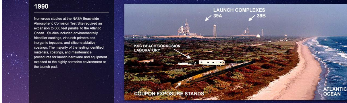
NASA Corrosion Test Laboratory and Site at Cape Canaveral,FL-USA next to Atlantic Ocean and space shuttle launch complexes ABD Florida Eyaleti Cape Canaveral'da Atlantik Okyanusu ve Uzay Mekikleri Fırlatma Rampalarına komşu NASA Test Laboratuvarı ve Sahası

Muhtemelen, Steve'i dünya çapındaki diğer Korozyon ve Boya/Kaplama Uzmanlarından ayıran şey, 1960'ların sonunda NASA Apollo 11 Programı için, NASA Kennedy Korozyon Test Merkezi' nde orijinal panel test sitesini kurduğu proje mühendisliği pozisyonudur. ( https://corrosion.ksc.nc.nv.gov/ )